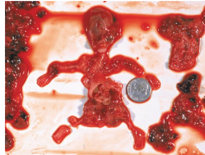
Enfant avorté à 9 semaines de grossesse