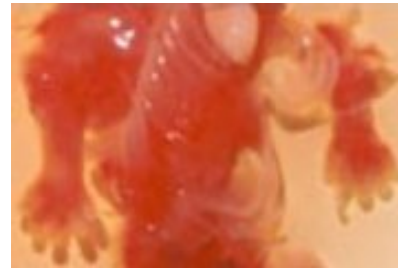
Enfant avorté à 7 semaines de grossesse

En 2006, le ministre de la santé M. Philippe Couillard implantait même une clinique d'avortement tardif à Montréal (c'est à dire jusqu'à 9 mois de grossesse)